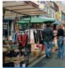
Organisée par le Lions Club de Montgeron

Le 14 mai, à 21h Centre Saint-Exupéry Entrée : 3 euros Tél. 01 69 42 69 47