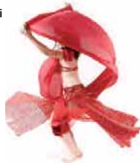
L'association des danses du Soleil vous emmène en voyage aux confins de l'Orient.