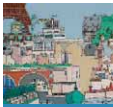
L'association des arts de l'AAM lève le voile sur six de ses artistes.

L'ensemble de musique baroque de Draveil et le chœur